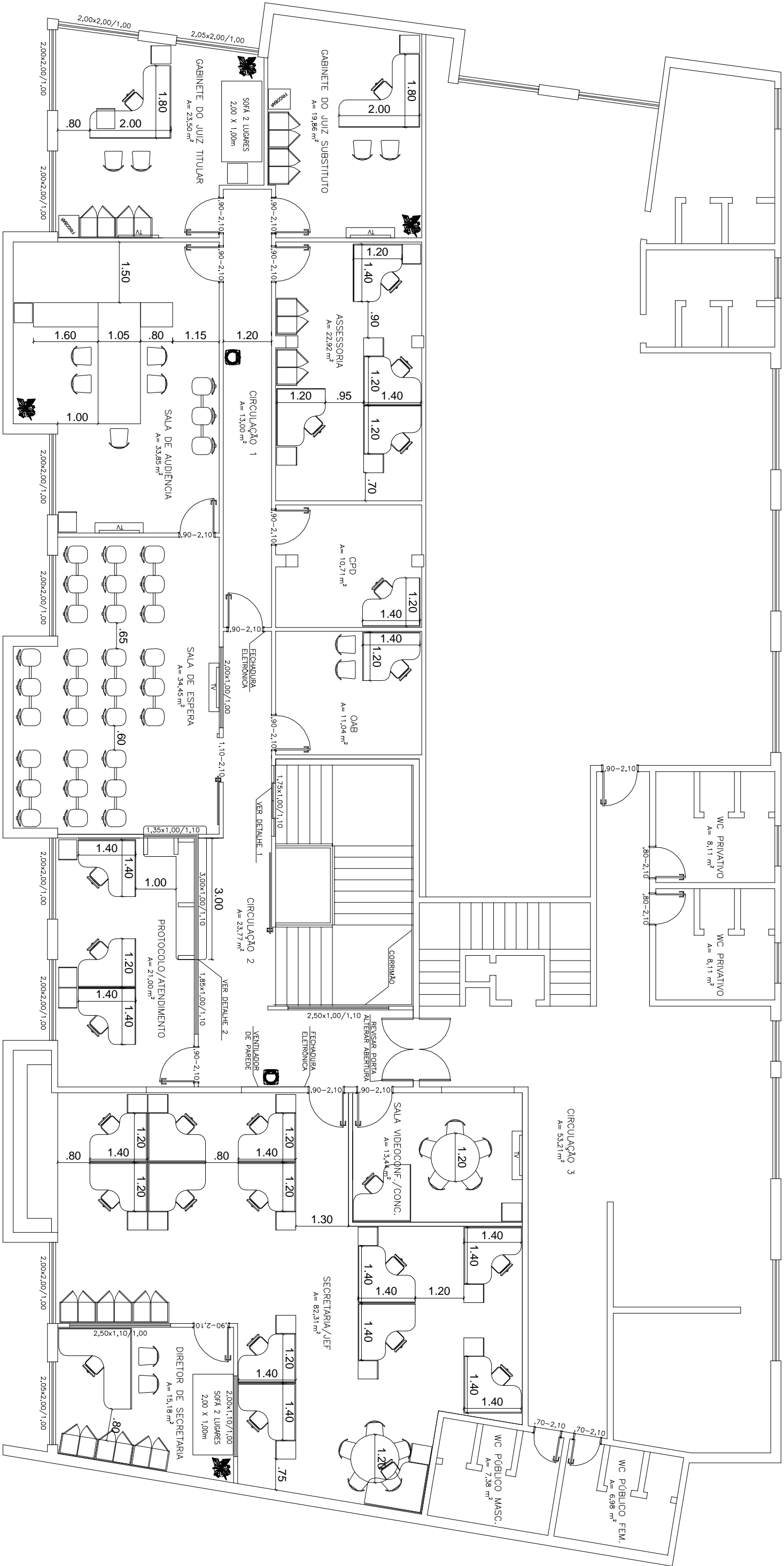
PLANTA-Baixa – 2º Pavimento Escala 1:100